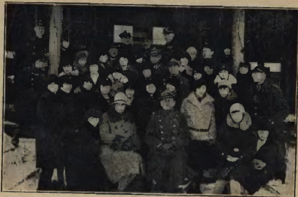
Żeński hufiec szkolny P. W. na strzelnicy.

Dyrektorowie i nauczyciele innych szkół, a w szczególności hospitolali nas w r. 1928. Koledzy z Kołomyji, Krzemieńca, Rozwadowa, Sambora, Sanoka, Stryja, Tarnopola i Złoczowa. Odwiedziny takie są nam zawsze bardzo miłe, a związana z nimi wymiana zapatrywań daje niewątpliwie obustronne korzyści.