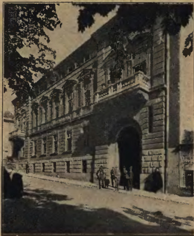
Gmach Tow. Szkoły Handlowej we Lwowie, przy ul. Franciszkańskiej 9.