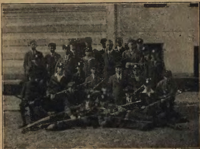
Męski hufiec szkolny P. W.

Celem zapoznania młodzieży z zabytkami kultury zwiedzono Muzeum Przemysłowe, Zbiory historyczne miasta Lwowa, Muzeum im. Sobieskiego, Muzeum przyrodnicze im. Dzieduszyckich, katedrę łacińską, ormiańską i kościół Dominikanów, gmach Izby przemysłowo-handlowej i Towarzystwa Kredytowego Ziemskiego, oraz Okrężną Wystawę przeciwalkoholową.