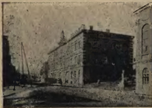
Budynek Szkoły T. S. H. w Jarosławiu.