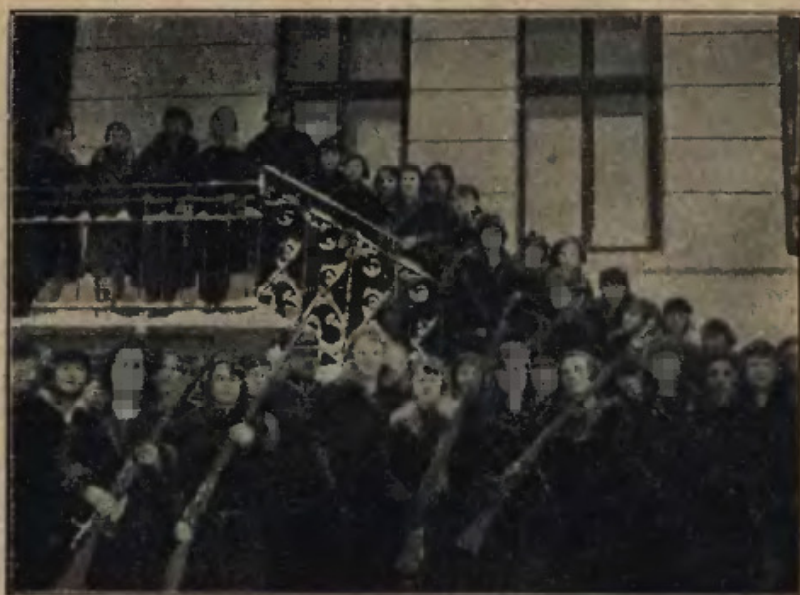
Zeński hufiec szkolny P. W.