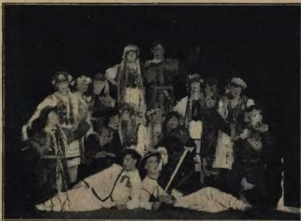
Produkcje taneczne młodzieży na Okręgowej Wystawie Szkolnej we Lwowie.