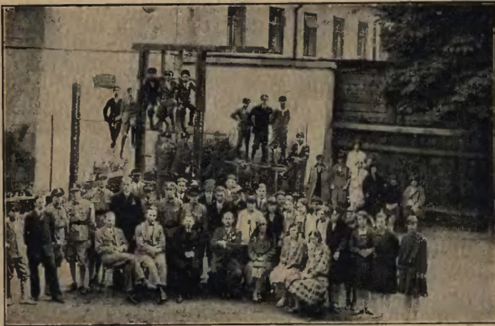
Młodzież na dziedzińcu szkolnym.