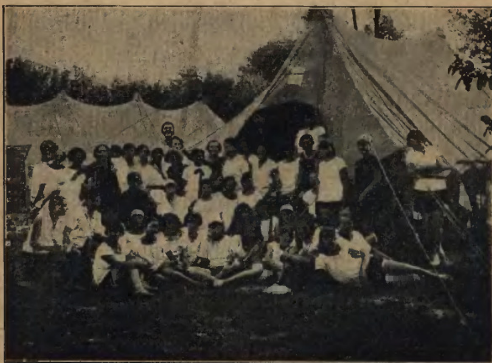
Obóz letni dziewcząt w Stężycy.

J. Cetnera, oraz w produkcjach Chóru Sem. Nauczycielsk., pod batutą prof. Adamczaka. W niedzielne zimowe popołudnia zbierała się młodzież w szkole, pod nadzorem Opiekunek klasowych, zabawiając się w gry towarzyskie, lub słuchając transmisyj radiowych. Chór szkolny, rozwijający się coraz lepiej brał zawsze wydatny udział w wszystkich uroczystościach, obchodach, nabożeństwach szkolnych i zabawach. Dochody z imprez, przeznaczane na fundusz wycieczkowy i fundusz niezamożnej młodzieży, wynosiły zł. 557.35.